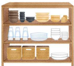
どうしてもテイストが合わないときは、カゴや木箱に「隠して」から「見せる」というのも1つの手です。

オープンな収納を行う際は、必ず防災についても考慮して、高いところに重いものや割れ物をしまわないのは鉄則です。